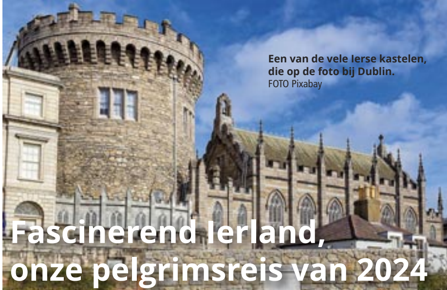
Een van de vele Ierse kastelen, die op de foto bij Dublin.

www.parochie-sintmaarten/kinderwoorddienst