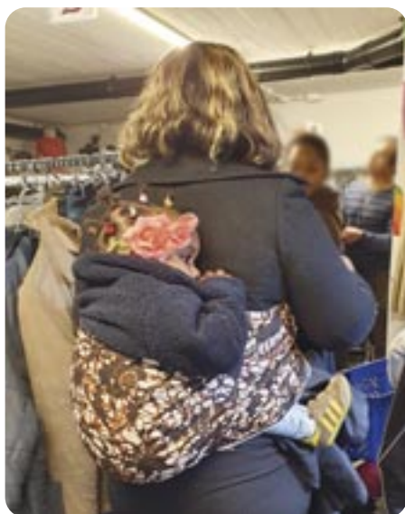
Kledingbank We Share is echt ontdekt door mensen die daar steun van ondervinden.

De vrijwilligers bij kledingbank We Share van parochie Sint Maarten bedanken hun sympathisanten voor alle giften die zij hebben ontvangen, speciaal de opbrengst van de collecte tijdens de kerstnachtdienst in Doorn.