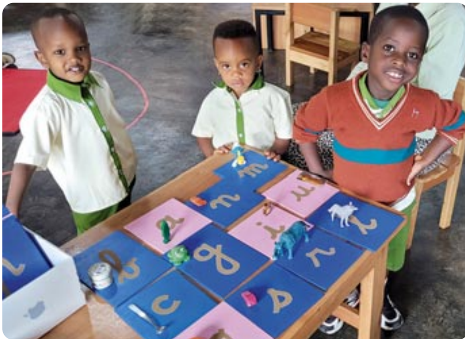
Leerlingen van de basisschool van Gemeenschap Emmanuel in Gitega, Burundi in een al – met hulp uit o.m. Sint Maarten – ingericht klaslokaal.

Onze parochie ondersteunt met de Vastenactie 2024, net als vorig jaar, de Stichting Fidesco. Die zet zich in voor de inrichting van een deel van een basisschool van de Gemeenschap Emmanuel in Gitega, de hoofdstad van Burundi. De school is in opbouw; in Burundi zijn te weinig scholen, de kwaliteit van het onderwijs is nog niet op orde. Onze actie richt zich op de inrichting van een klas. Burundi is het op één na armste land ter wereld, met een bevolking waarvan de helft jonger is dan 15 jaar.