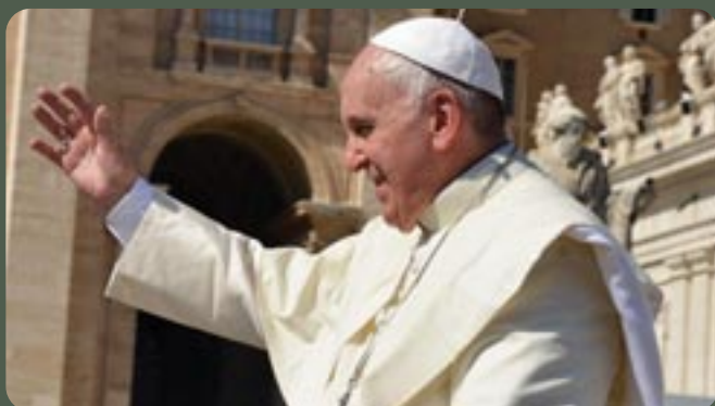
Paus Franciscus over klimaat: 'Nog urgenter geworden.'

Op de feestdag van de H. Franciscus van Assisi (4 oktober) verscheen Laudate Deum (Prijs God) , een apostolische exhortatie (pauselijke brief) van paus Franciscus. Deze is een vervolg op zijn encycliek Laudato Si' (Geprezen zijt Gij) uit 2015 en is nu in een Nederlandse vertaling beschikbaar.