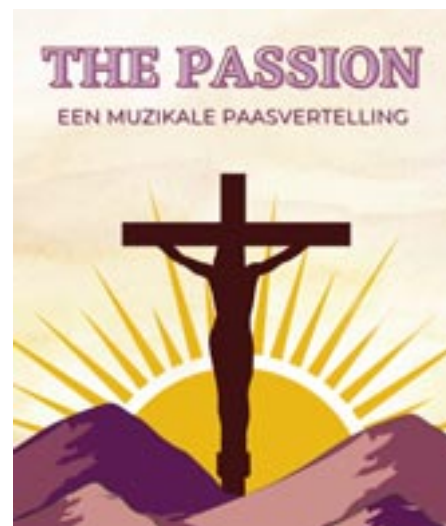
Passion-poster.