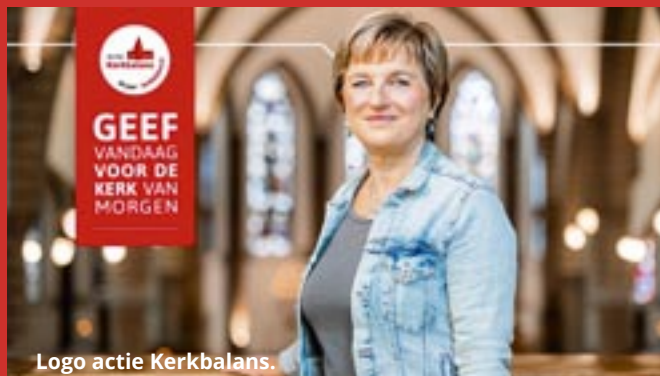
Logo actie Kerkebalans.