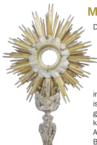
Monstrans van Driebergen-Rijsenburg, staat centraal bij de aanbidding.

Eerstvolgende data: 10 februari en 9 maart. Tijd: 15.00-16.00 uur. Plaats: St. Petrus' bandenkerk, Kerkplein 5, Driebergen-Rijsenburg.